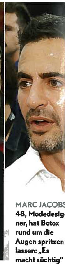
MARC JACOBS 48, Modedesigner, hat Botox rund um die Augen spritzen lassen: „Es macht süchtig“

den ist und unter anderem Gelenke und Muskeln geschmeidig hält. Mittlerweile ist sie zum Star unter den Füllsubstanzen geworden. Warum eigentlich?