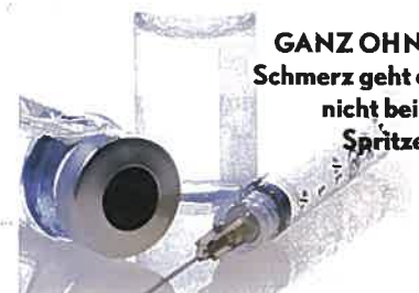
GANZ OHN Schmerz geht nicht bei Spritze

Wirkung: Das Fett wird während einer Lokalanästhesie z. B. aus dem Unterbauchbereich oder der Innenseite des Knies entnommen, gefiltert und gereinigt. Das reine Fettgewebe wird dann direkt in die Falten gespritzt und