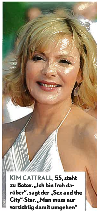
KIM CATTRALL, 55, steht zu Botox. „Ich bin froh darüber“, sagt der „Sex and the City“-Star. „Man muss nur vorsichtig damit umgehen“

Dagegen hilft, was Profis „Volumenausgleich“ nennen: Wo es an Masse fehlt, wird nachgespritzt. Filler wie Hyaluronsäure zum Beispiel, eine gelartige Substanz, die in fast jeder unserer Körperzellen zu fin-