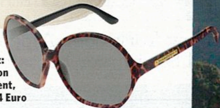
Sichtschutz: Sonnenbrille von Yves Saint Laurent, ca. 204 Euro