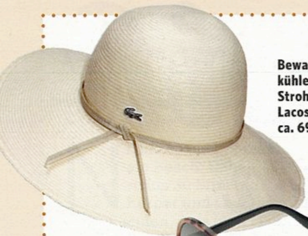
Bewahrt einen kühlen Kopf: Strohhut von Lacoste, ca. 69 Euro